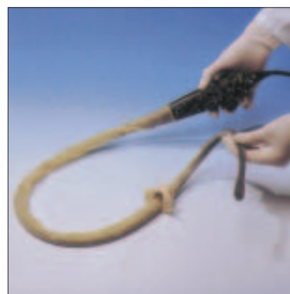
6. Jetzt ist die Sonde einsatzbereit.