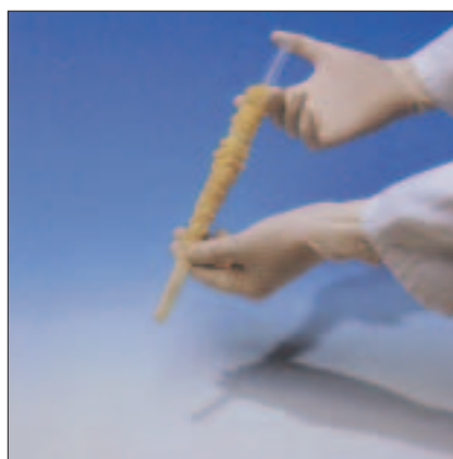
2. Die Latexhülle auf die Spritze schieben. Anschließend das Transmissionsgel in die Spitze der Hülle drücken.