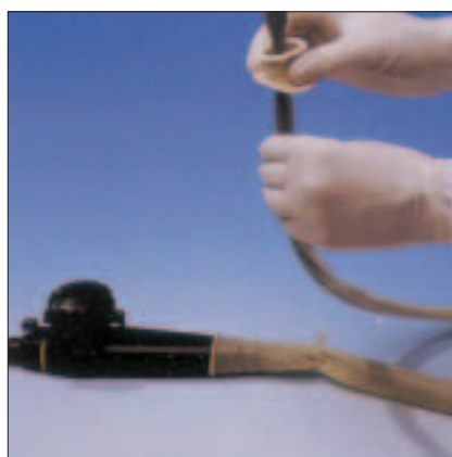
5. Die Latexhülle mithilfe der Drehverriegelung befestigen und den Beißschutz montieren.