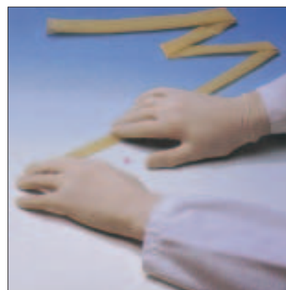
3. Das Gel verteilen.