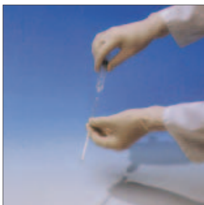
1. Die Kappe entfernen und das Anschlussstück an der Spritze befestigen.